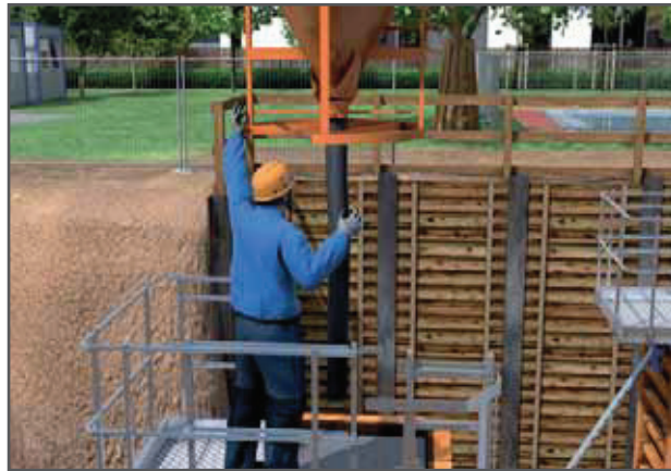
Beispiel für einen Industrieschutzhelm nach EN 397

• Weiterhin können Industrieschutzhelme bestimmte elektrisch isolierende Eigenschaften haben, bei Gefährdung durch flüssige Metallspritzer oder bei Gefährdung durch seitliche Beanspruchung schützen. In der Herstellerinformation zu jedem Helm ist nachzulesen, welche Eigenschaften der Helm bietet.